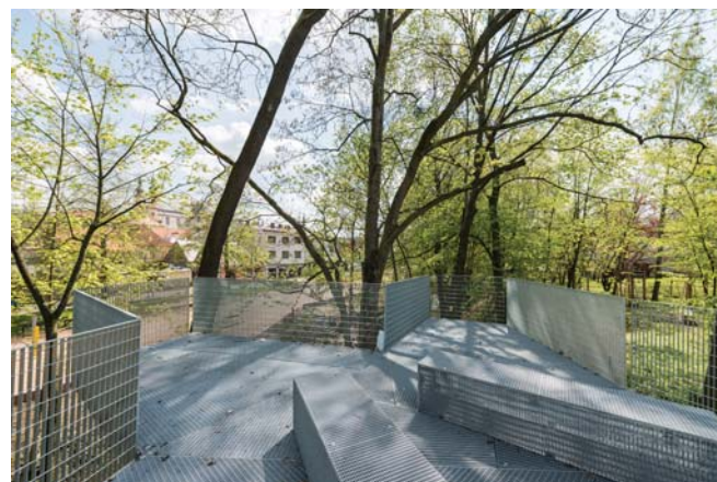
6 Nevzhledný objekt vodárny nad říčkou architekti využili k vytvoření vyhlídky.