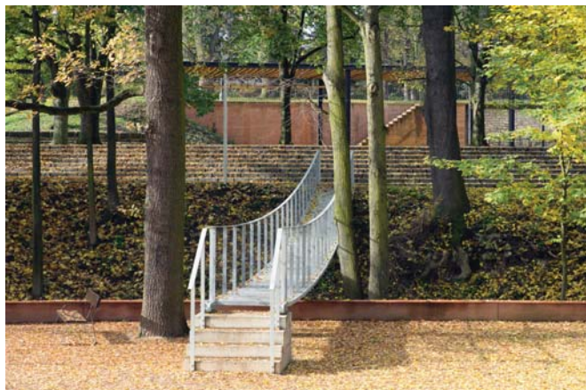
3 Řeka Loučná je nově přemostěna subtilní zavěšenou pěší lávkou.