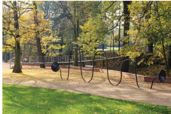
5 Atypický herní prvek Lochneska (Cik cak?).