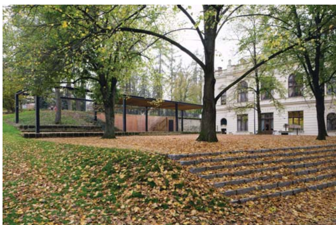
4 Park u Smetanova domu doplnil pavilon se zelenou střechou k pořádání kulturních akcí a s posezením pod vzrostlými stromy.