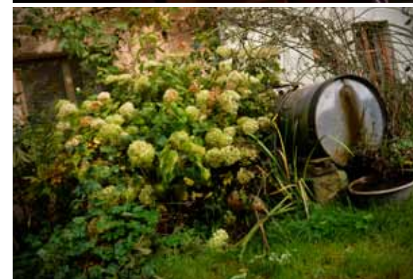
Výhled z okna kuchyně na kvetoucí durman (nahoře). Strukturu rostlin lze přes zimu využít jako dekorativní prvek.

Ve svém království Jitka zásadně nic nestříká, prořezané větve jen nechává okolo sadu, kde vytvářejí jednoduchý, impozantní plot. Vypadá jako objekt land artu, jedné z jejích dalších profesionálních vášní.