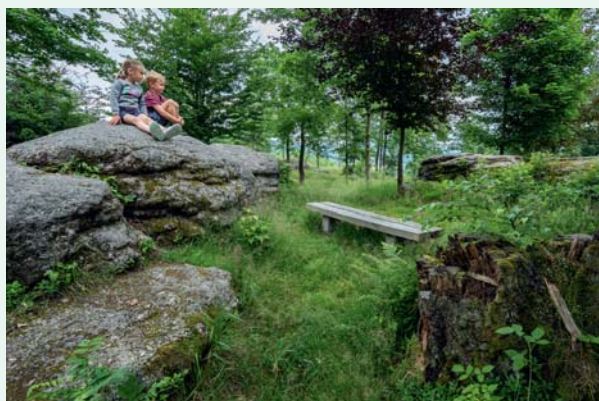
Koncepce obnovy městského lesoparku Smržovka, 2018; foto: Alena Makovcová.