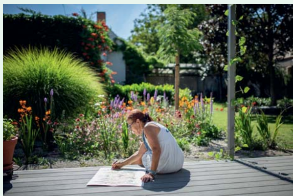
Realizace soukromé zahrady v Brandýse nad Labem, 2019