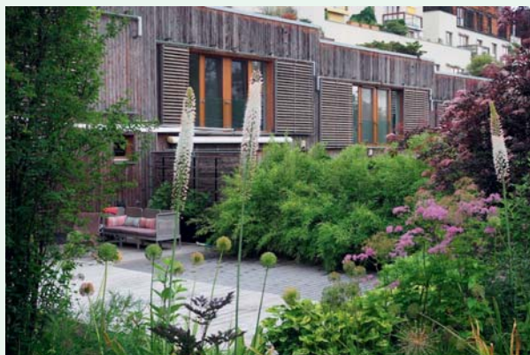
Detail soukromé zahrady v Praze-Košířích, realizace 2018, foceno 2022