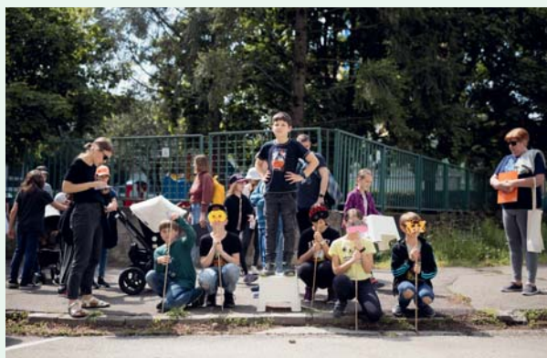
Pilotní aktivity v rámci projektu Ulice pro děti, 2022; MIB prostřednictvím projektu pracuje na zlepšení podmínek pro nezávislou mobilitu dětí