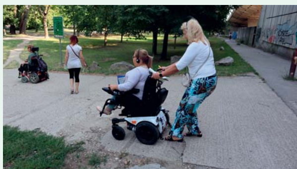
Bezbariérová a bezpečnostní vycházka v rámci participativního procesu revitalizace parku Sad Janka Kráľa v Bratislavě, 2021