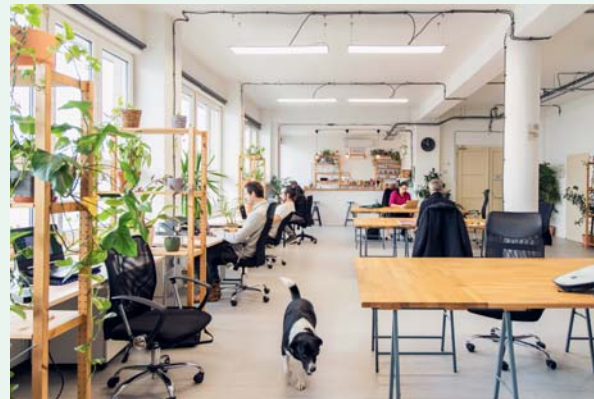
Coworking Cvernovka v Bratislavě