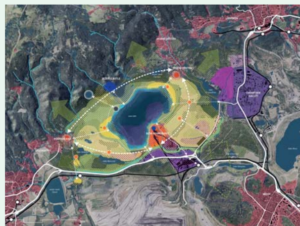
Kancelář ONplan zpracovávala v roce 2021 koncept využití nové krajiny vzniklé rekultivací hnědouhelného lomu ČSA nedaleko Mostu; zdroj: ONplan.