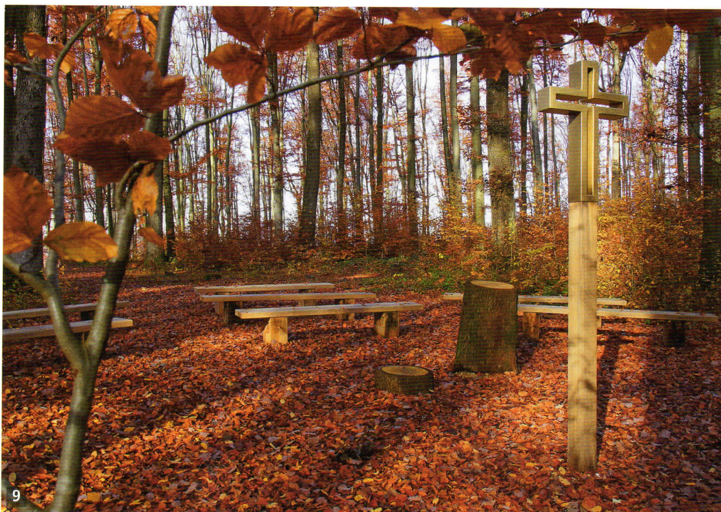
9, 10 FriedWald – Les Míru. Od roku 1993 si lze ve Švýcarsku vybrat v jednom z 70 takových vybraných lesů strom svého posledního klidu