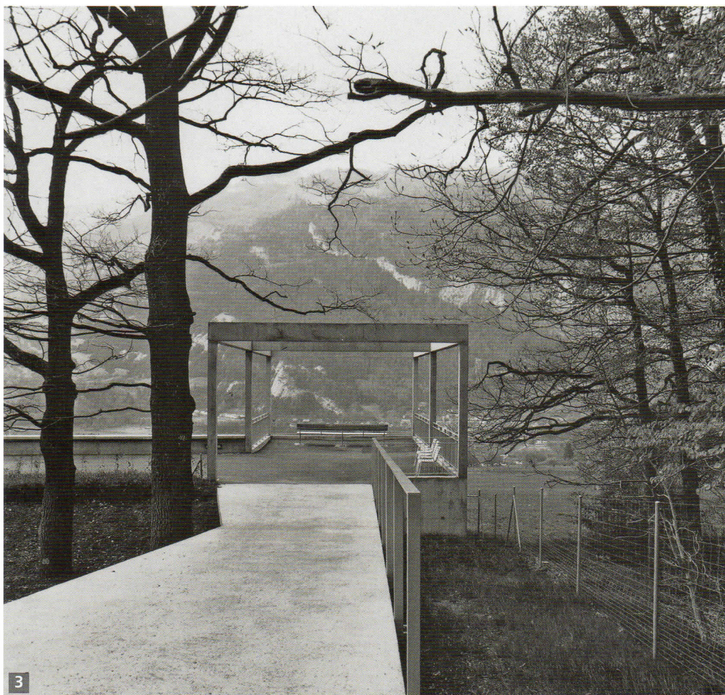
Altán na konci promenádní cesty, výhled do krajiny nabízí rozptýlení smutných myšlenek, odtud navazuje cesta přímo dál do lesa na procházkovou cestní síť