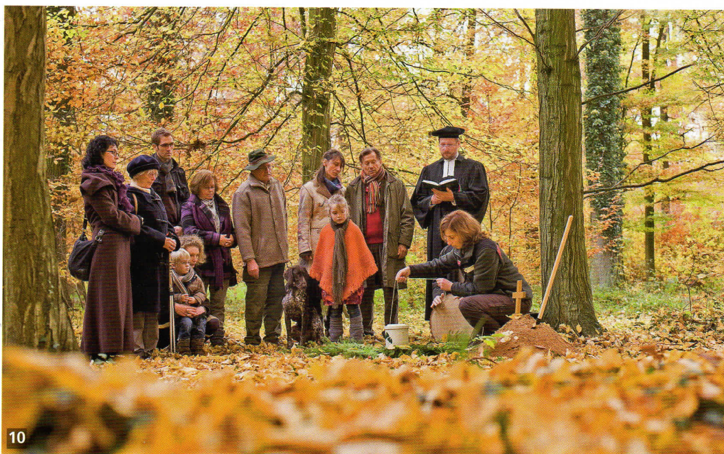
Uložení urny (mnohdy biologicky rozložitelné)

čení stromů či míst nebo dokonce náhrobky či květinová výzdoba. Rozloučení podle přání může proběhnout na místě, ale i klasicky v kostele či síni. Vzpomínat se pak chodí na procházku do krásného lesa.